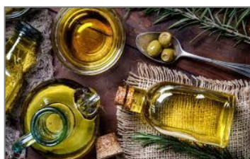
Aceite de Oliva